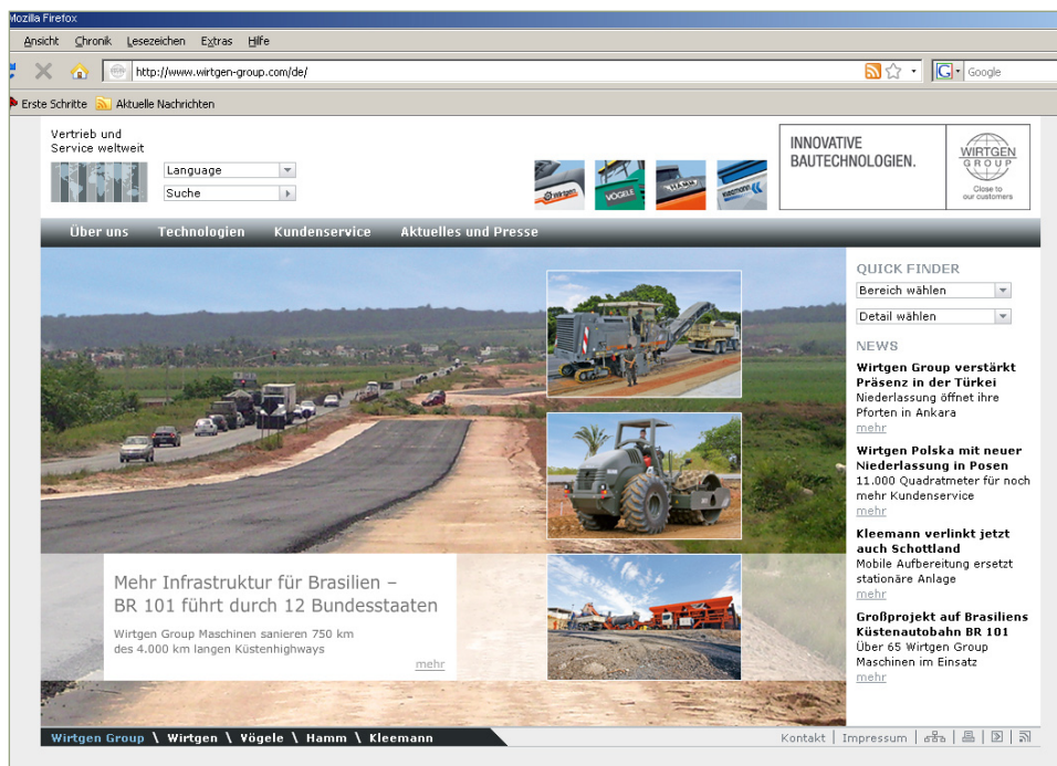
Homepage der Wirtgen Group

Als komplexeste Herausforderung galt das Mandanten-Konzept: Da jede Vertriebs- und Servicegesellschaft der Wirtgen Group über einen eigenen Internetauftritt verfügt, muss das CMS in der Lage sein, verschiedene Mandanten zu verwalten. Diese können jeweils mit einer eigenen Benutzerverwaltung ausgestattet sein, so dass jedes Land das eigene Internet-Angebot koordinieren kann. Kommen zusätzlich zentral verwaltete Informationen, wie zum Beispiel Pressemitteilungen der Wirtgen Group und ihrer Marken oder die markenspezifischen Produktdaten hinzu, muss das Content-Management-System in der Lage sein, Inhalte mandantenübergreifend bereitzustellen.